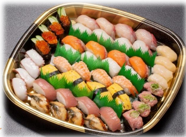
にぎりセット (四人前) 5,000円 (税込) より