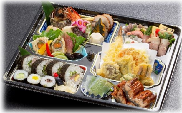
「偲」 3,500円 (税込)