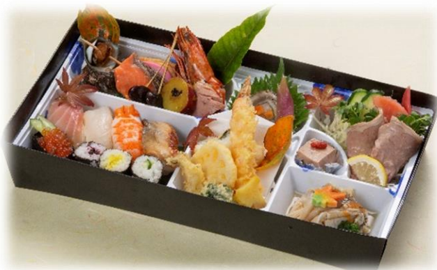
「大人用」 2,500円 (税込)