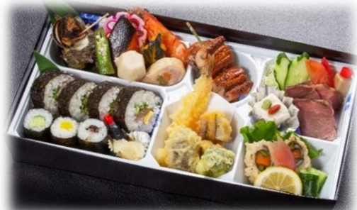
「祈」 2,500円 (税込)