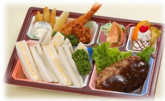
「お子様用」 1,000円 (税込)