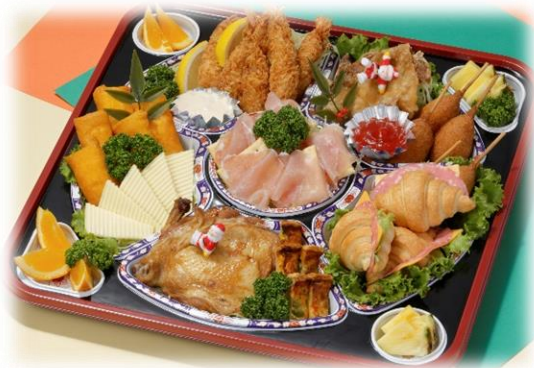
オードブル 3,500円 (税込) より